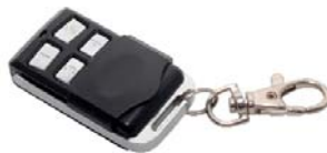
Emisor llavero CROSS CROSS keychain transmitter Émetteur clé CROSS MINI keychain transmitter Emissor de lhaveiro CROSS