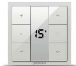
Emisor pared 15 canales CROSS CROSS 15 channels wall transmitter Émetteur mural 15 canaux CROSS Trasmettitore parete 15 canali CROSS Emissor de parede 15 canais CROSS