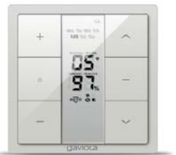
Reloj programador CROSS CROSS clocked transmitter Horloge programmable CROSS Programmatore orario CROSS Relógio programador CROSS