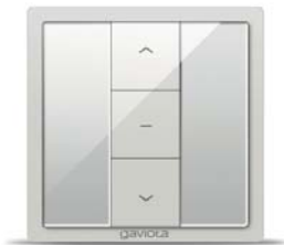
Emisor pared 1 canal CROSS CROSS 1 channel wall transmitter Émetteur mural 1 canal CROSS Trasmettitore parete 1 canale CROSS Emissor de parede 1 canal CROSS